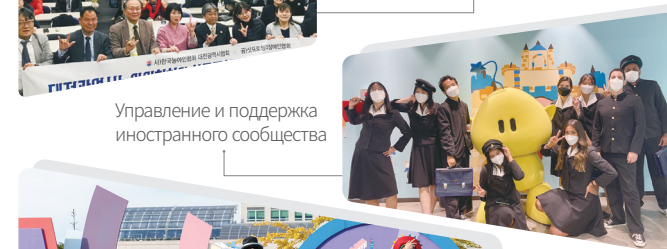
Управление и поддержка иностранного сообщества