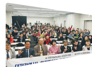
Поддержка международного обмена среди частных организаций