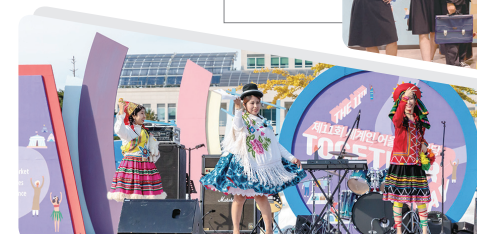
Фестиваль встречи космополитов